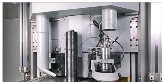
▲ Aktives Kühlkonzept