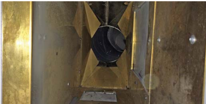
▼ Schleifraum mit Partikeldeflektor