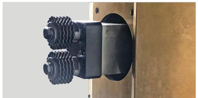
▼ Automatische Abrichteinheit