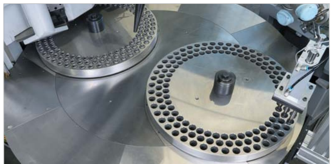
▲ G 450 Doppeltellervariante