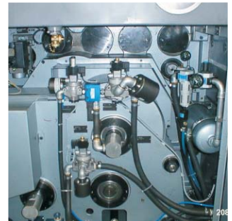
FUL 10 - alt