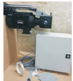
▲ Frequenzgespeister Einzugsmotor