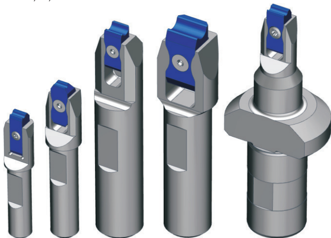
▲ Halter mit Windeinsatz - Typen