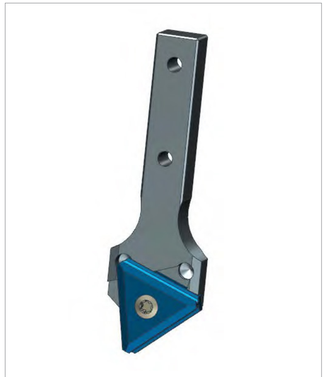
▲ Windeplattenhalter mit Windeplatte